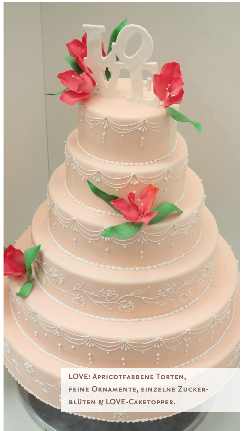
LOVE: APRICOTFARBENE TORTEN, FEINE ORNAMENTE, EINZELNE ZUCKER- BLÜTEN & LOVE-CAKETOPPER.