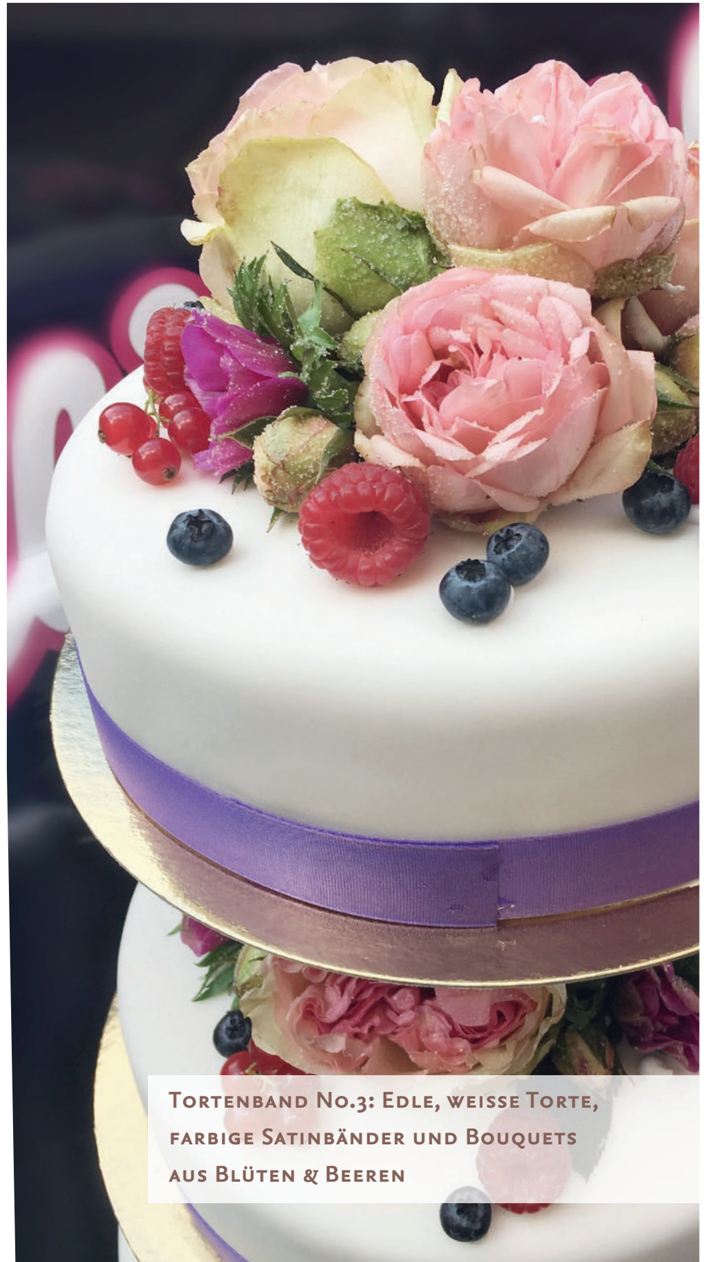
TORTENBAND No.3: EDLE, WEISSE TORTE, FARBIGE SATINBÄNDER UND BOUQUETS AUS BLÜTEN & BEEREN