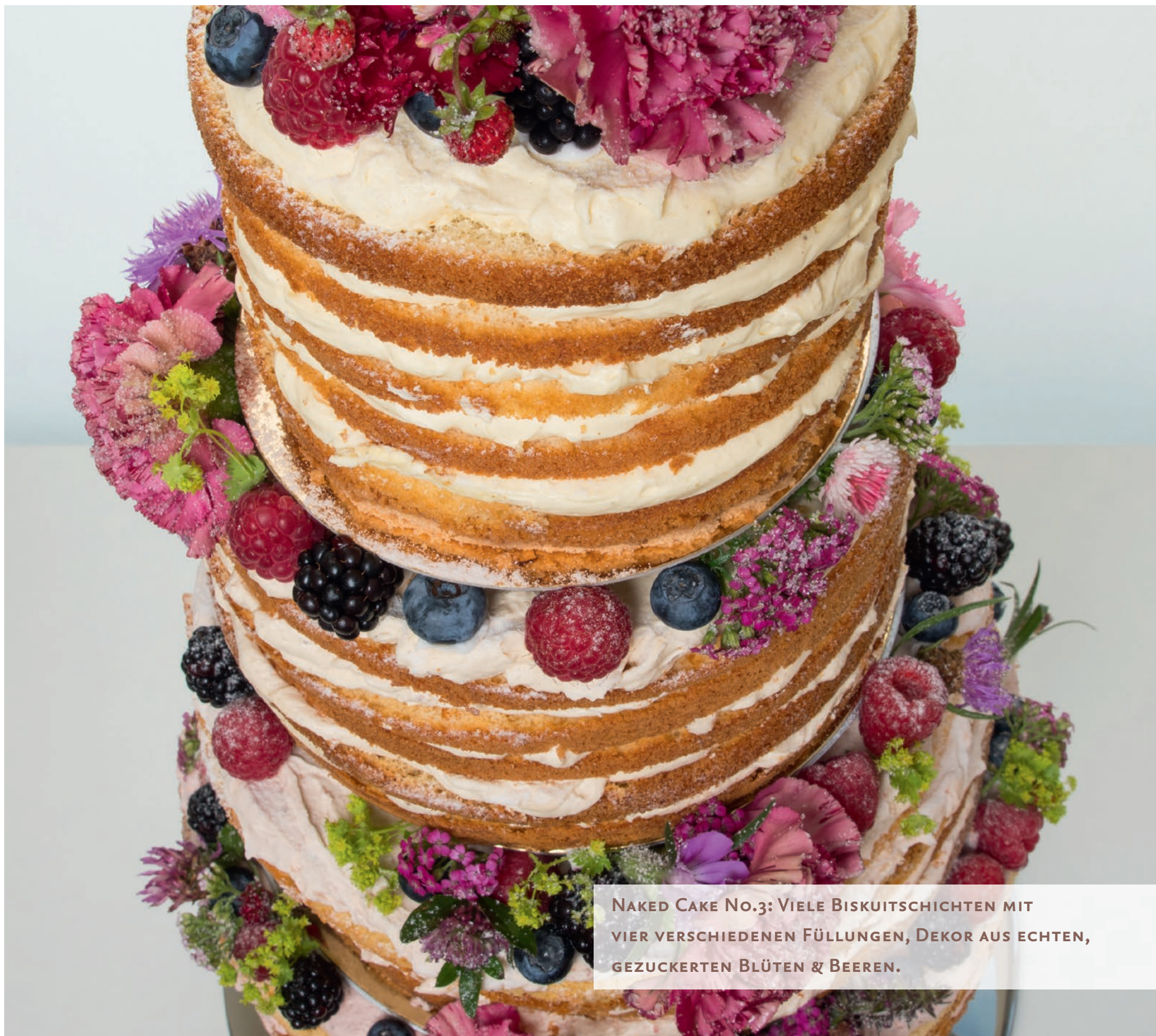
NAKED CAKE No.3: VIELE BISKUI TSCHICHTEN MIT VIER VERSCHIEDENEN FÜLLUNGEN, DEKOR AUS ECHTEN, GEZUCKERTEN BLÜTEN & BEEREN.