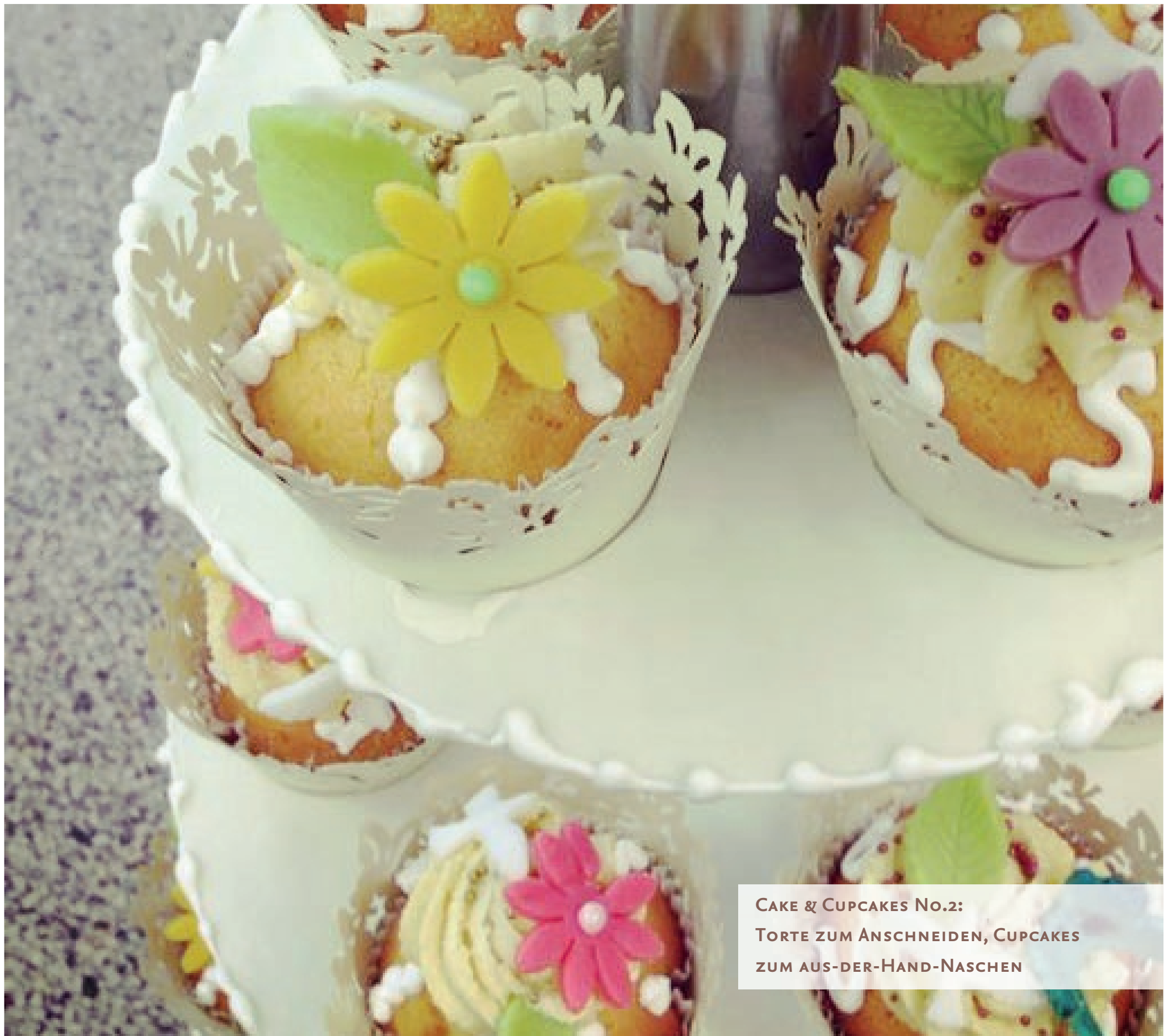
CAKE & CUPCAKES No.2: TORTE ZUM ANSCHNEIDEN, CUPCAKES ZUM AUS-DER-HAND-NASCHEN