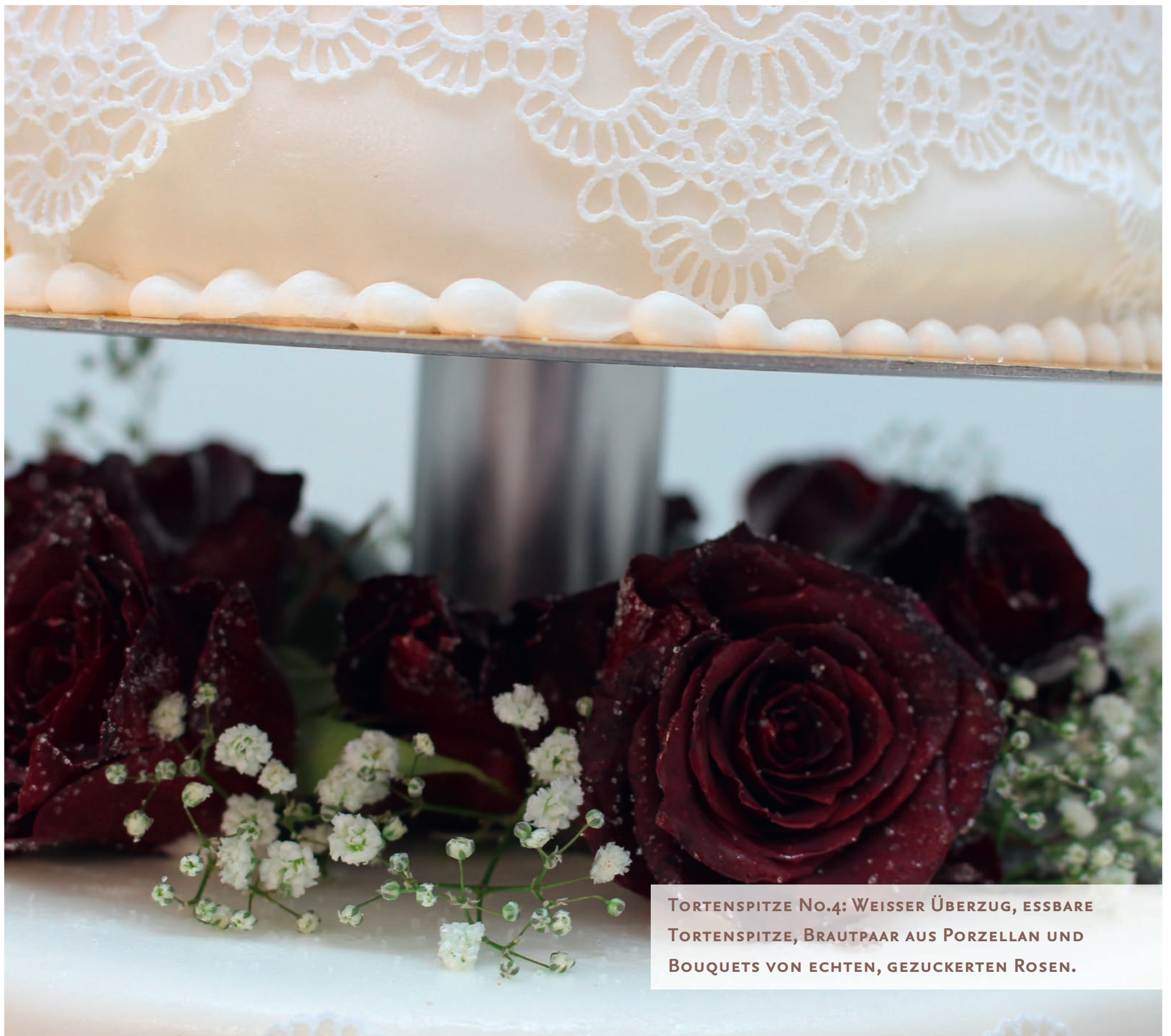
TORTENSPITZE NO.4: WEISSER ÜBERZUG, ESSBARE TORTENSPITZE, BRAUTPAAR AUS PORZELLAN UND BOUQUETS VON ECHTEN, GEZUCKERTEN ROSEN.