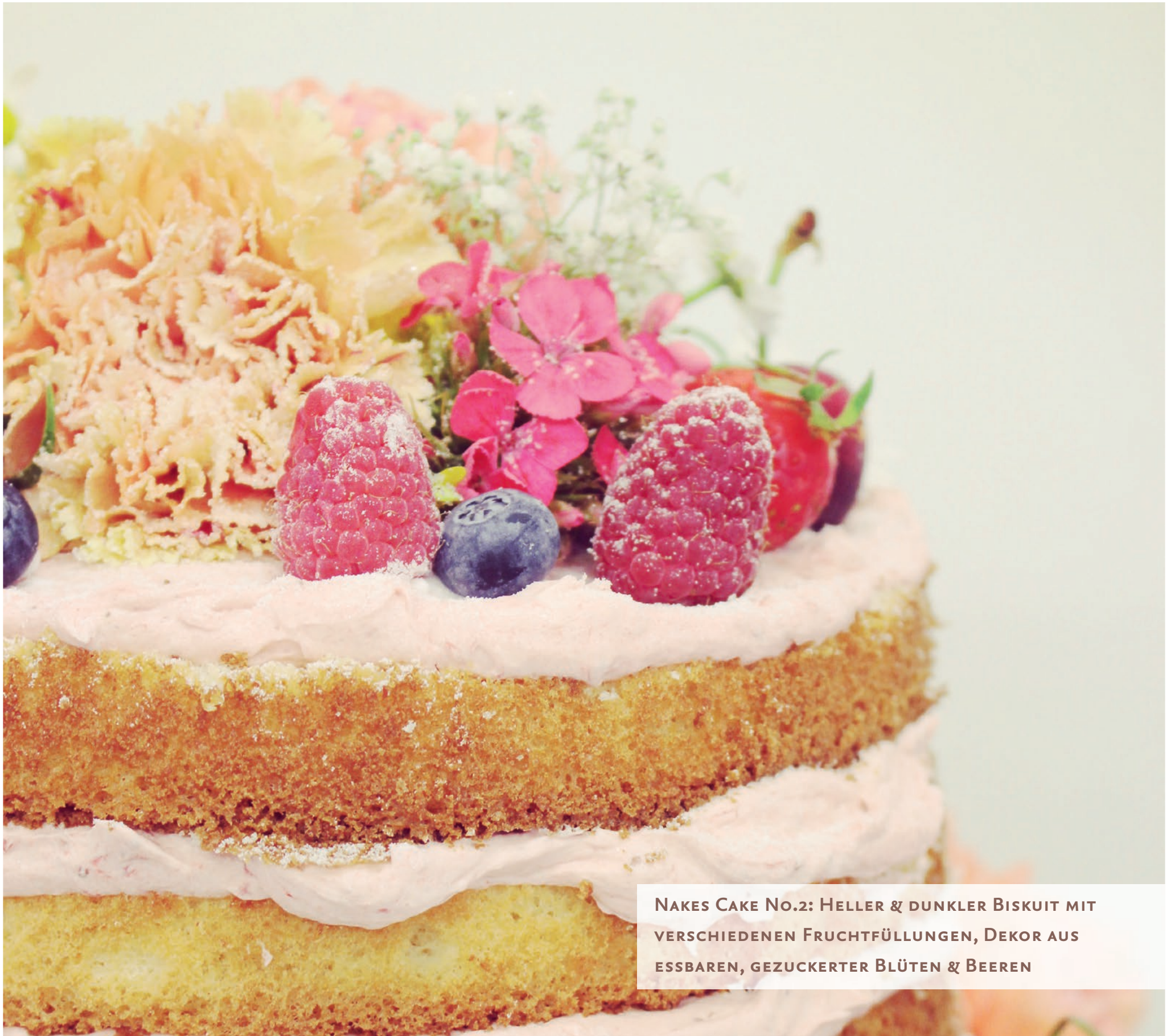
NAKES CAKE NO.2: HELLER & DUNKLER BISKUIT MIT VERSCHIEDENEN FRUCHTFÜLLUNGEN, DEKOR AUS ESSBAREN, GEZUCKERTER BLÜTEN & BEEREN