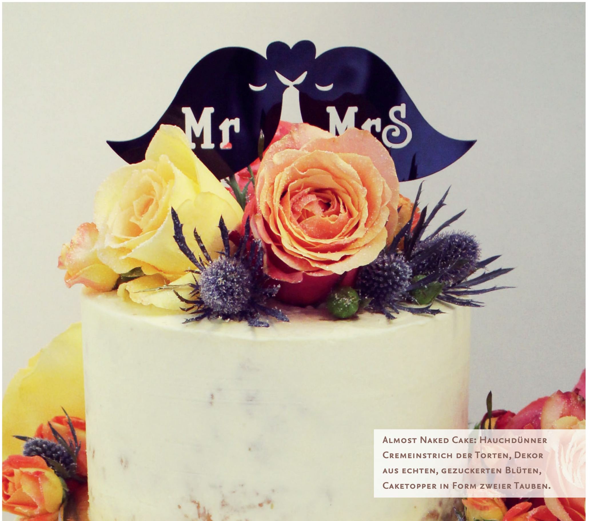
ALMOST NAKED CAKE: HAUCHDÜNNER CREMEINSTRICH DER TORTEN, DEKOR AUS ECHTEN, GEZUCKERTEN BLÜTEN, CAKETOPPER IN FORM ZWEIER TAUBEN.