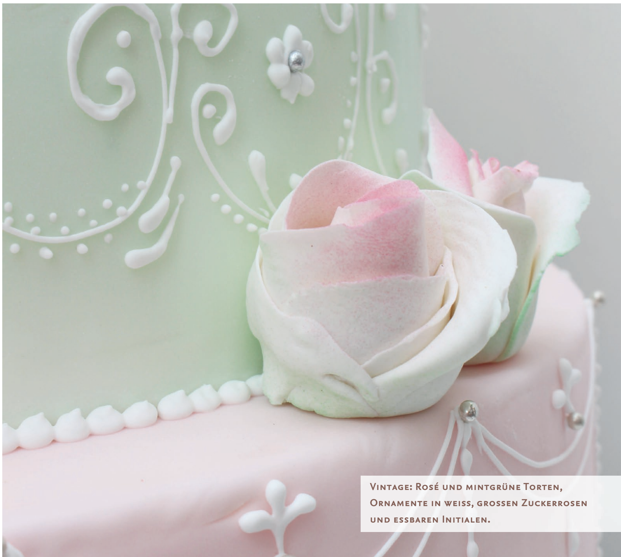
VINTAGE: ROSÉ UND MINTGRÜNE TORTEN, ORNAMENTE IN WEISS, GROSSEN ZUCKERROSEN UND ESSBAREN INITIALEN.