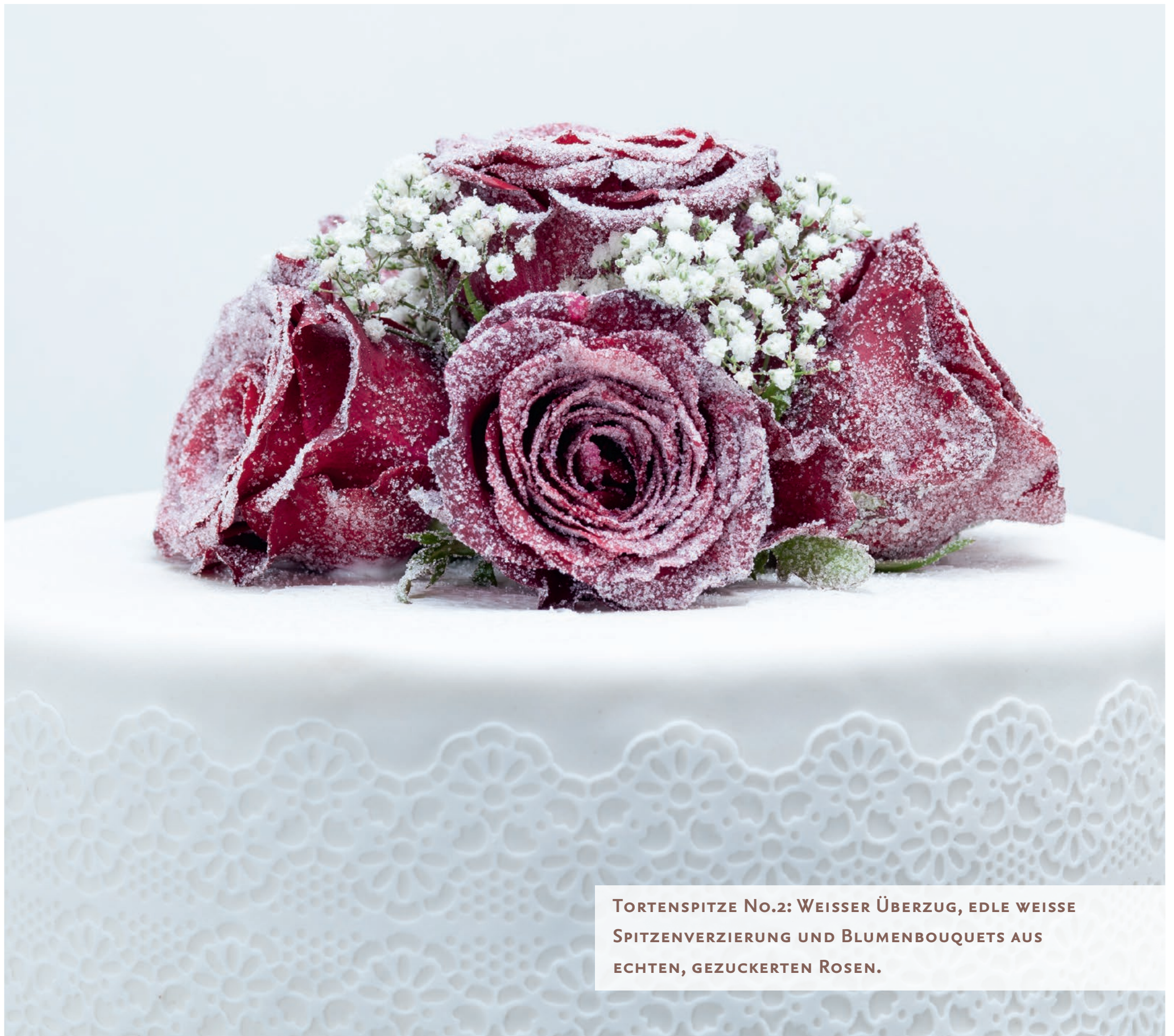
TORTENSPIITZE NO.2: WEISSER ÜBERZUG, EDLE WEISSE SPITZENVERZIERUNG UND BLUMENBOUQUETS AUS ECHTEN, GEZUCKERTEN ROSEN.