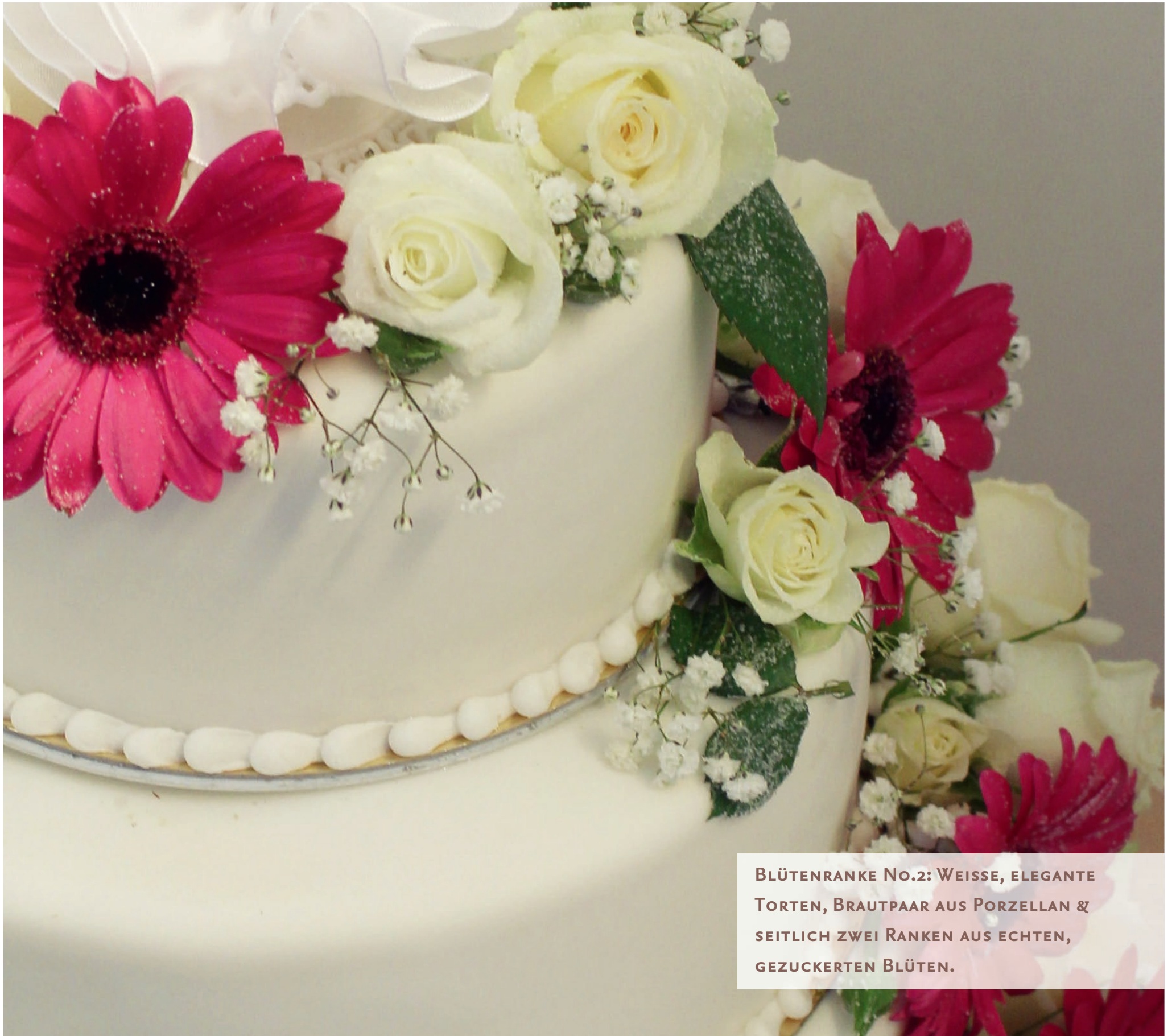
BLÜTENRANKE NO.2: WEISSE, ELEGANTE TORTEN, BRAUTPAAR AUS PORZELLAN & SEITLICH ZWEI RANKEN AUS ECHTEN, GEZUCKERTEN BLÜTEN.