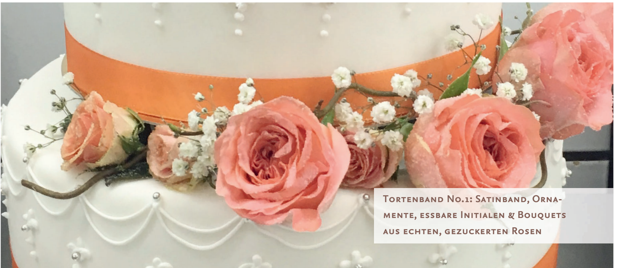
TORTENBAND No.1: SATINBAND, ORNA- MENTE, ESSBARE INITIALEN & BOUQUETS AUS ECHTEN, GEZUCKERTEN ROSEN