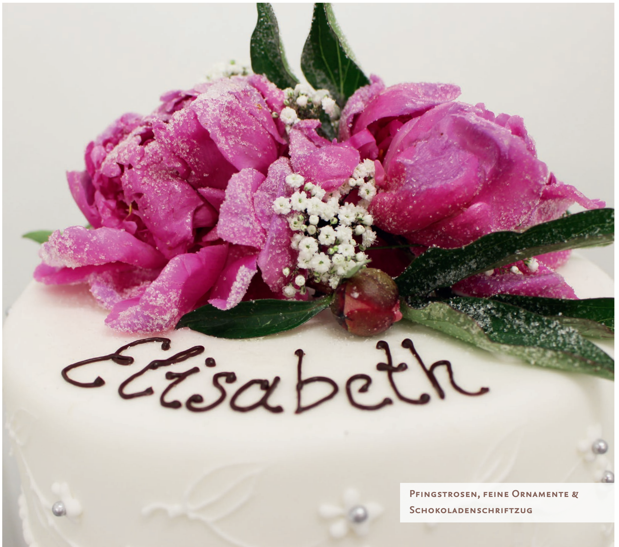
PFINGSTROSEN, FEINE ORNAMENTE & SCHOKOLADENSCHRIFTZUG