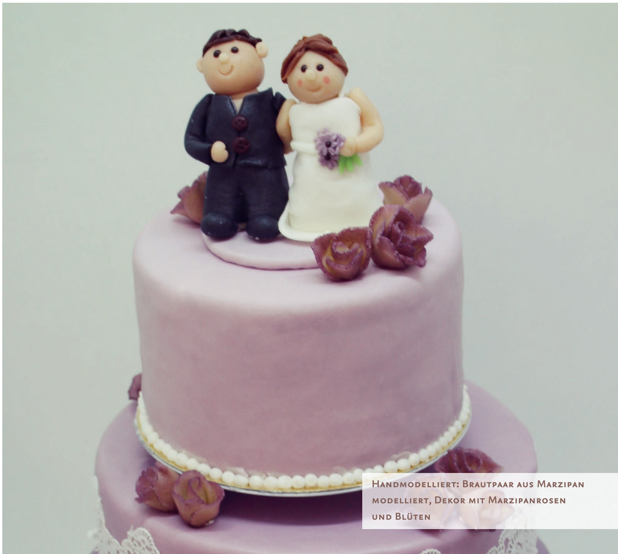
HANDMODELLIERT: BRAUTPAAR AUS MARZIPAN MODELLIERT, DEKOR MIT MARZIPANROSEN UND BLÜTEN