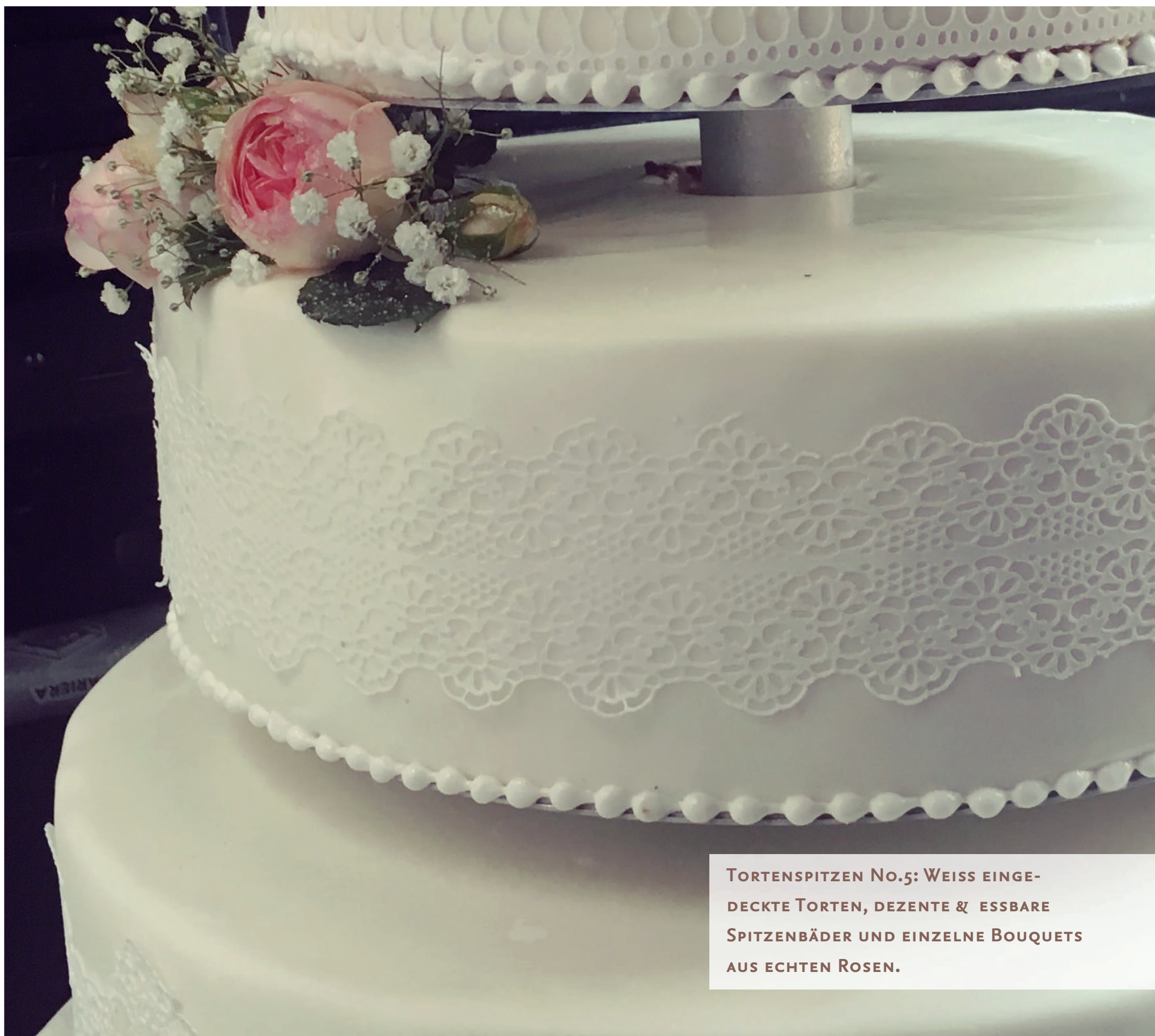
TORTENSPITZEN No.5: WEISS EINGE- DECKTE TORTEN, DEZENTE & ESSBARE SPITZENBÄDER UND EINZELNE BOUQUETS AUS ECHTEN ROSEN.