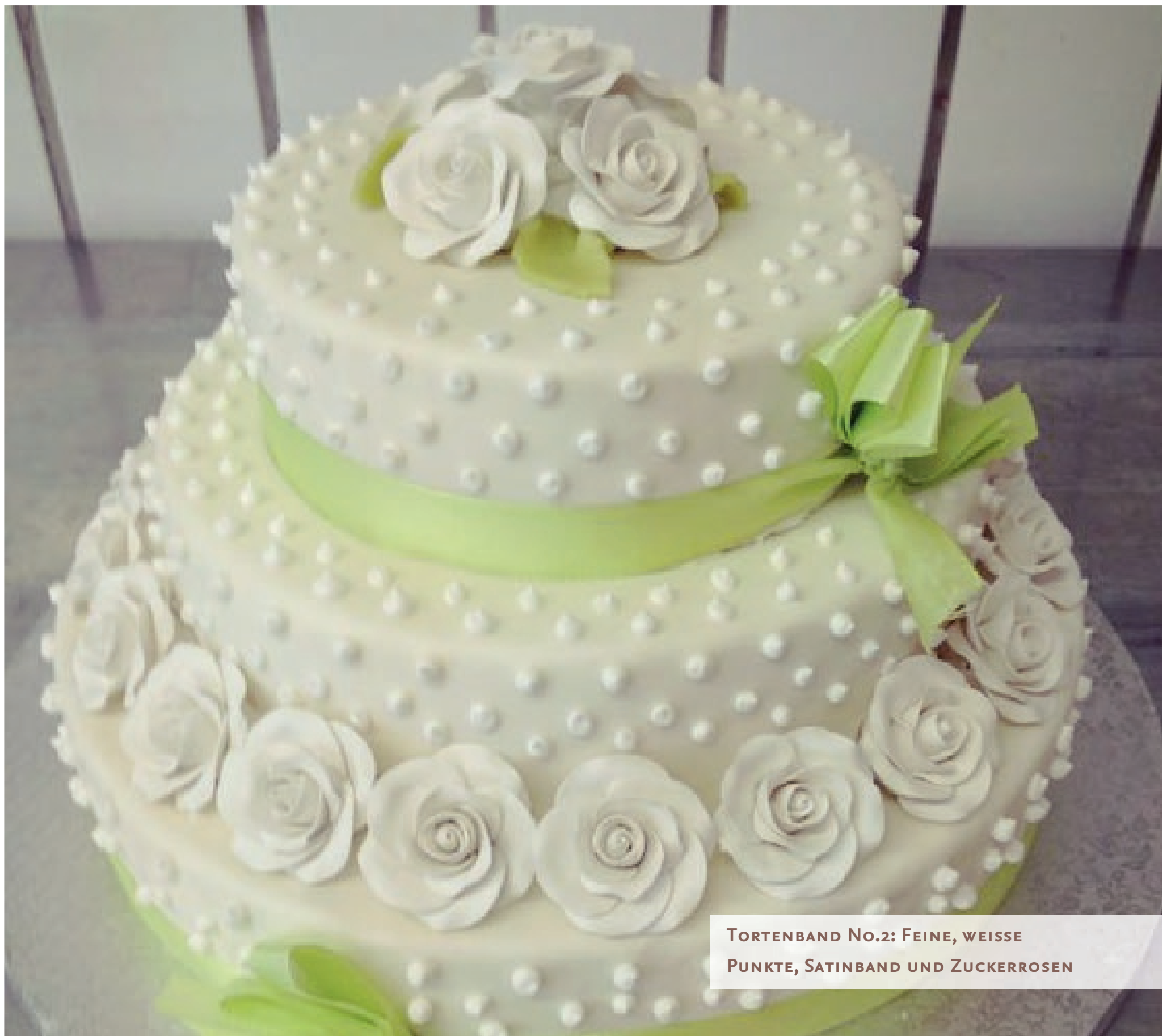
TORTENBAND No.2: FEINE, WEISSE PUNKTE, SATINBAND UND ZUCKERROSEN