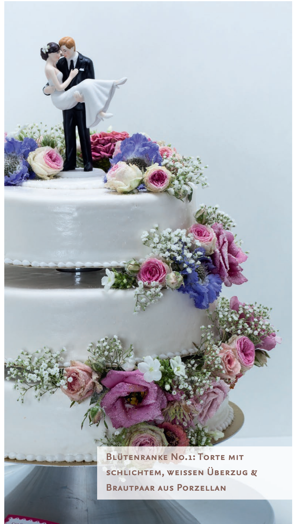
BLÜTENRANKE No.1: TORTE MIT SCHLICHTEM, WEISSEN ÜBERZUG & BRAUTPAAR AUS PORZELLAN