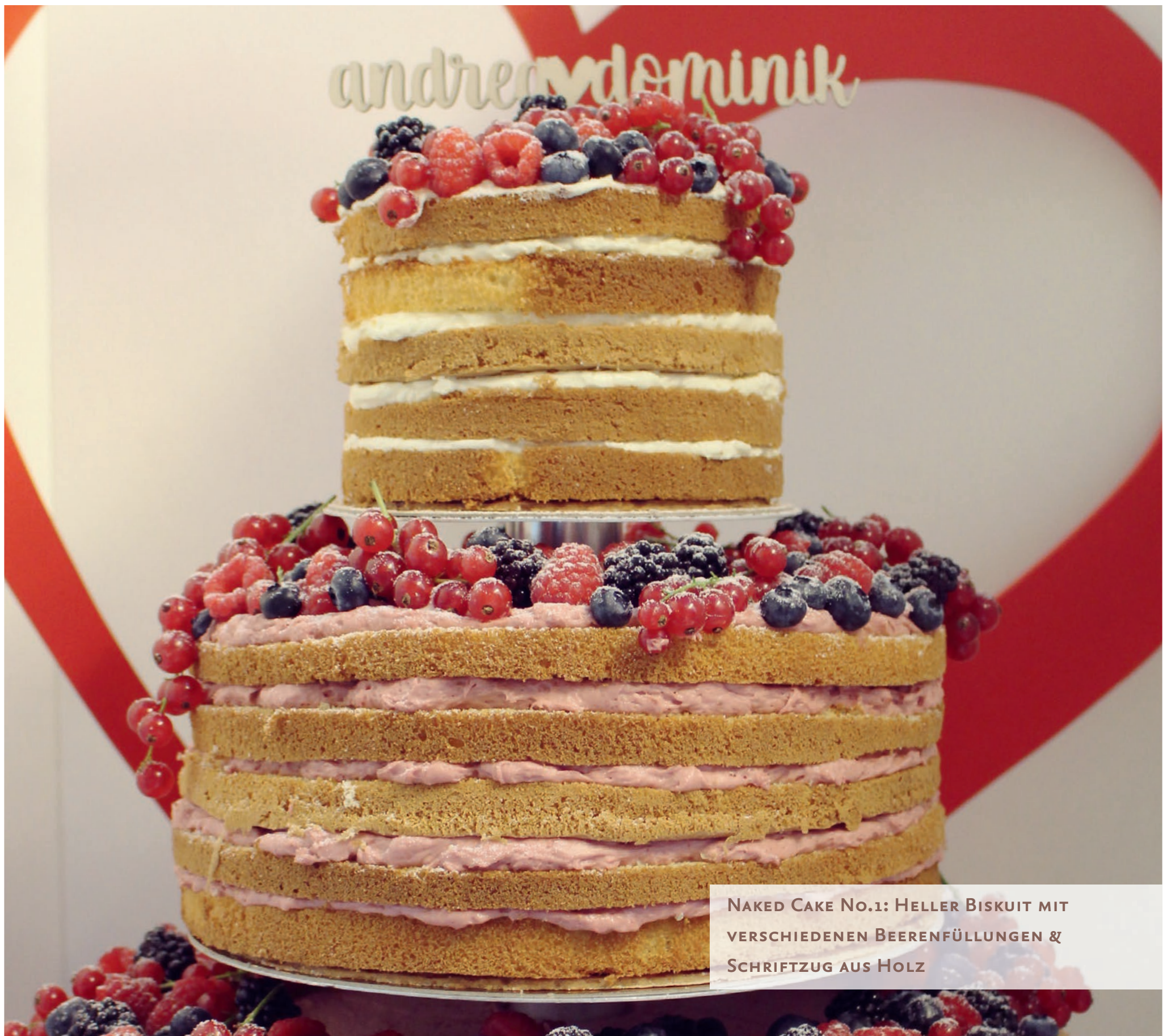
NAKED CAKE No.1: HELLER BISKUIT MIT VERSCHIEDENEN BEERENFÜLLUNGEN & SCHRIFTZUG AUS HOLZ