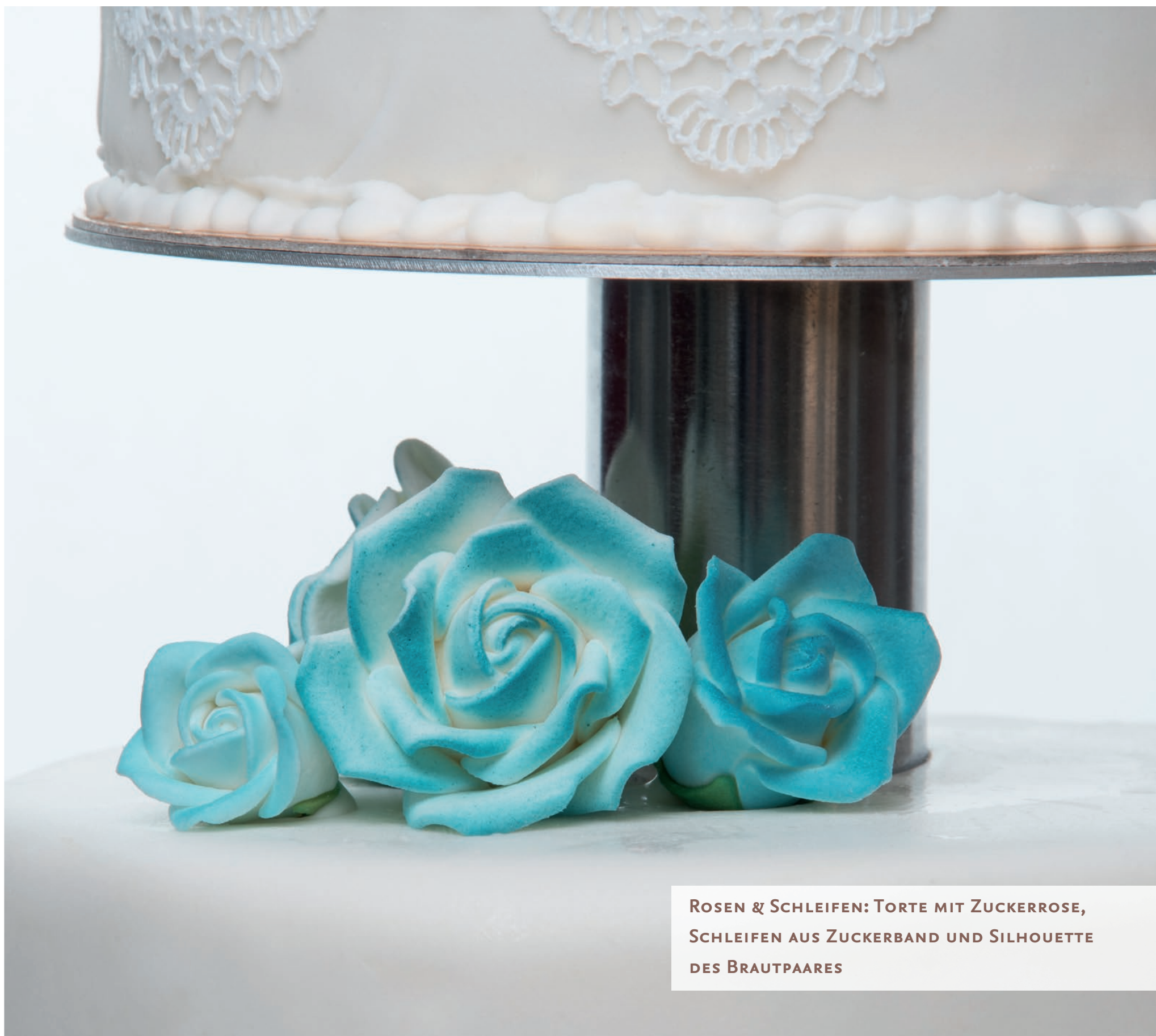
ROSEN & SCHLEIFEN: TORTE MIT ZUCKERROSE, SCHLEIFEN AUS ZUCKERBAND UND SILHOUETTE DES BRAUTPAARES