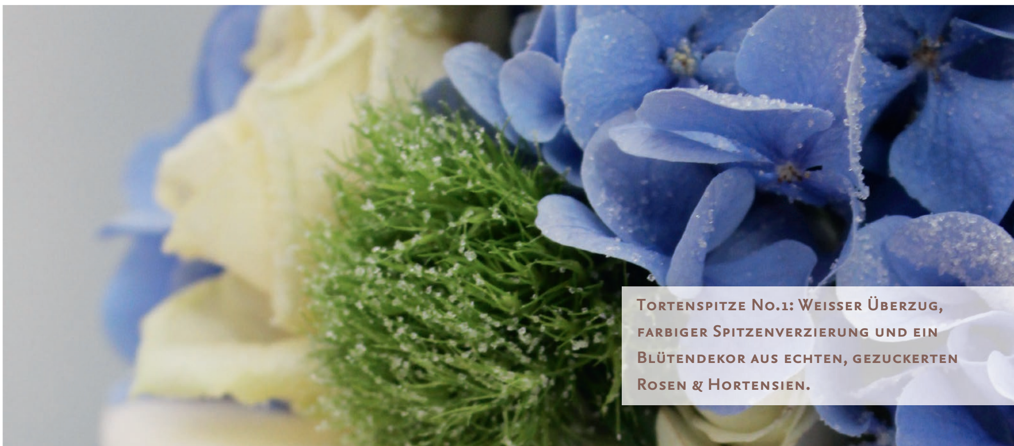
TORTENSPIITZE NO.1: WEISSER ÜBERZUG, FARBIGER SPITZENVERZIERUNG UND EIN BLÜTENDEKOR AUS ECHTEN, GEZUCKERTEN ROSEN & HORTENSIIEN.