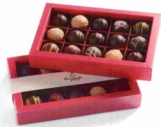
Trüffel-Box in vielen unterschiedlichen Größen erhältlich