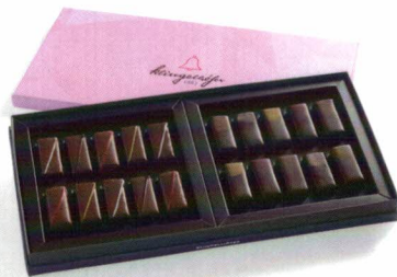
Klingelhöfer-Box in 4 unterschiedlichen Größen erhältlich