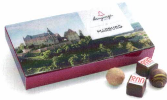
Marburg-800-Box in 2 unterschiedlichen Größen erhältlich