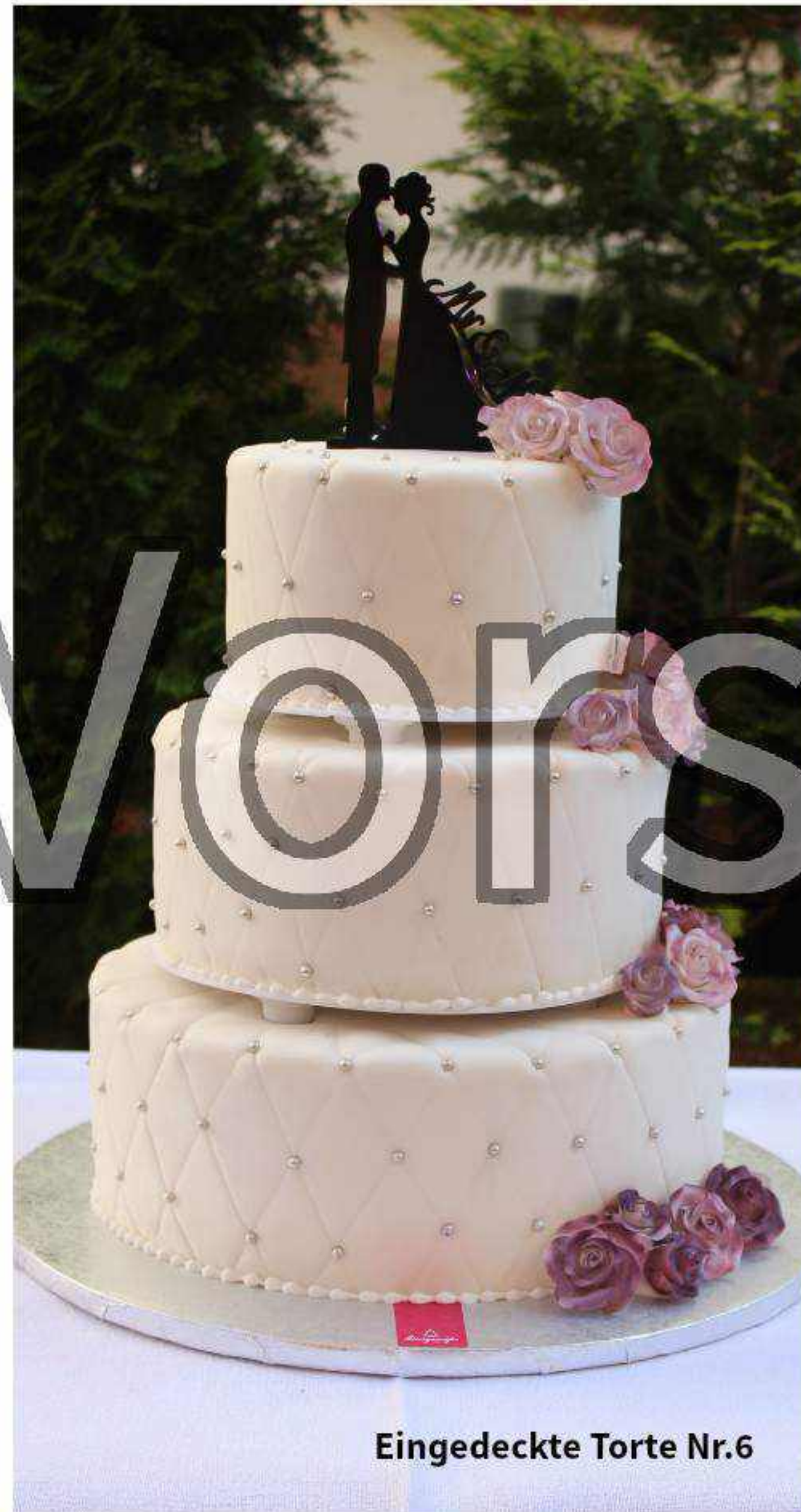
Eingedeckte Torte Nr.6