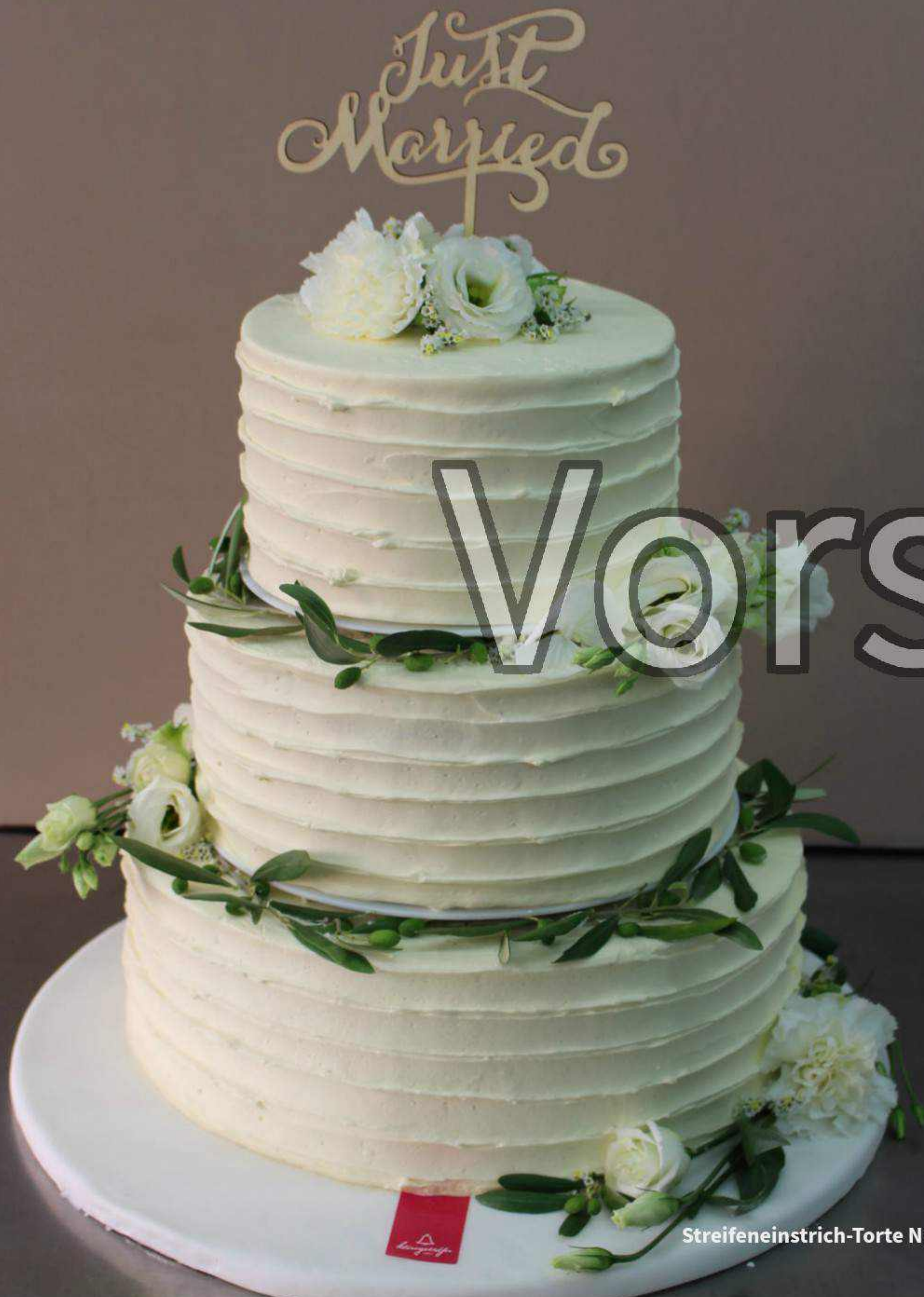
Streifeneinstrich-Torte Nr. 2