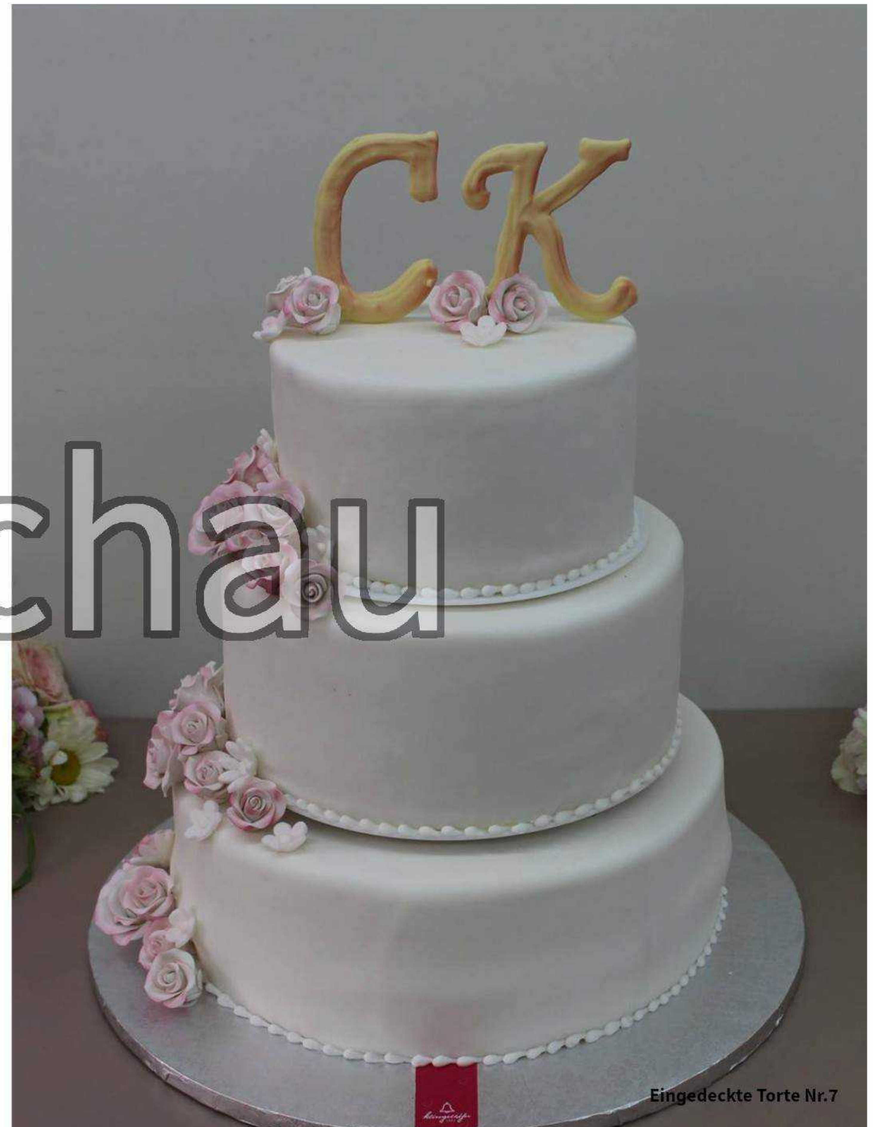
Eingedeckte Torte Nr.7