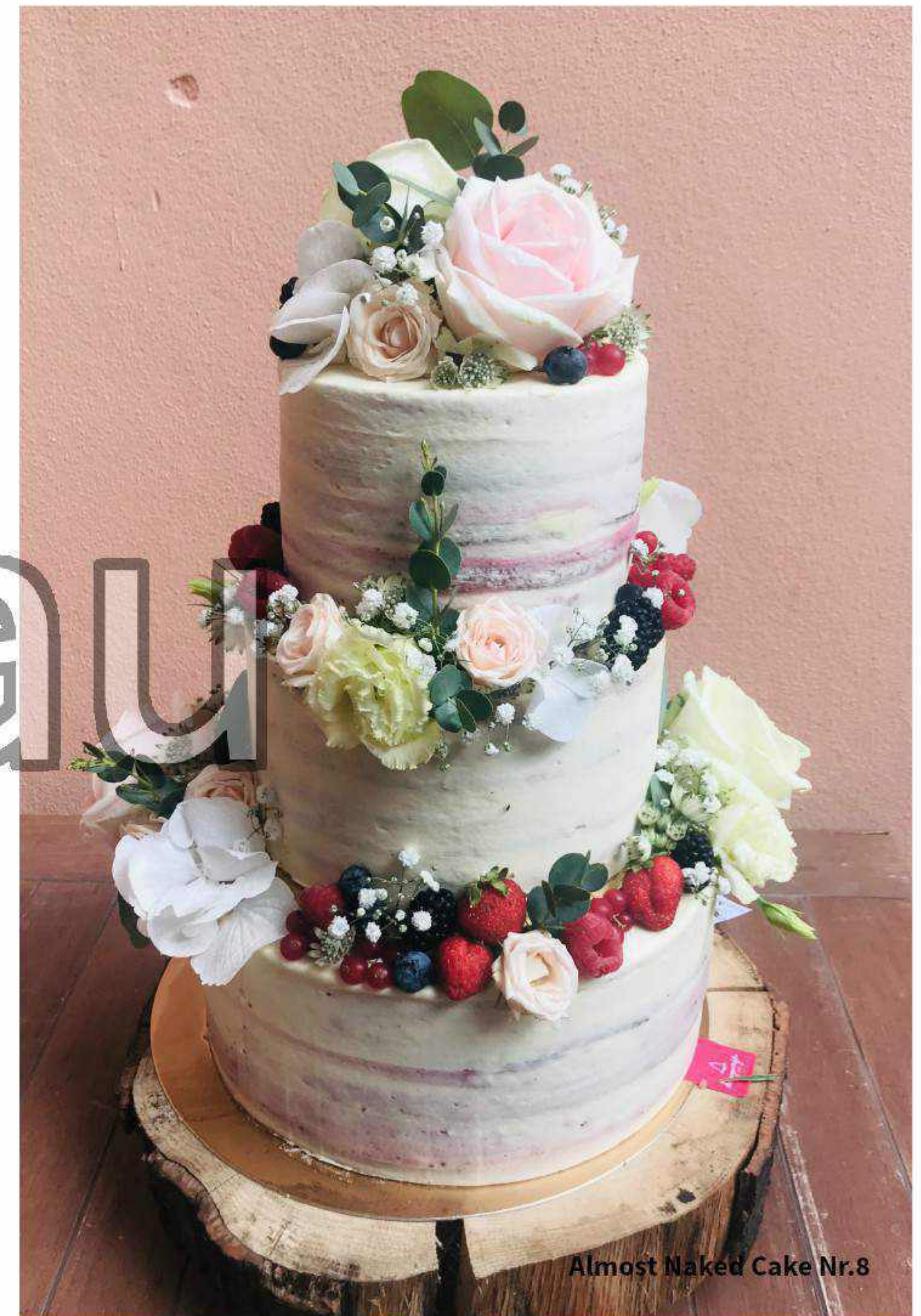
Almost Naked Cake Nr.8