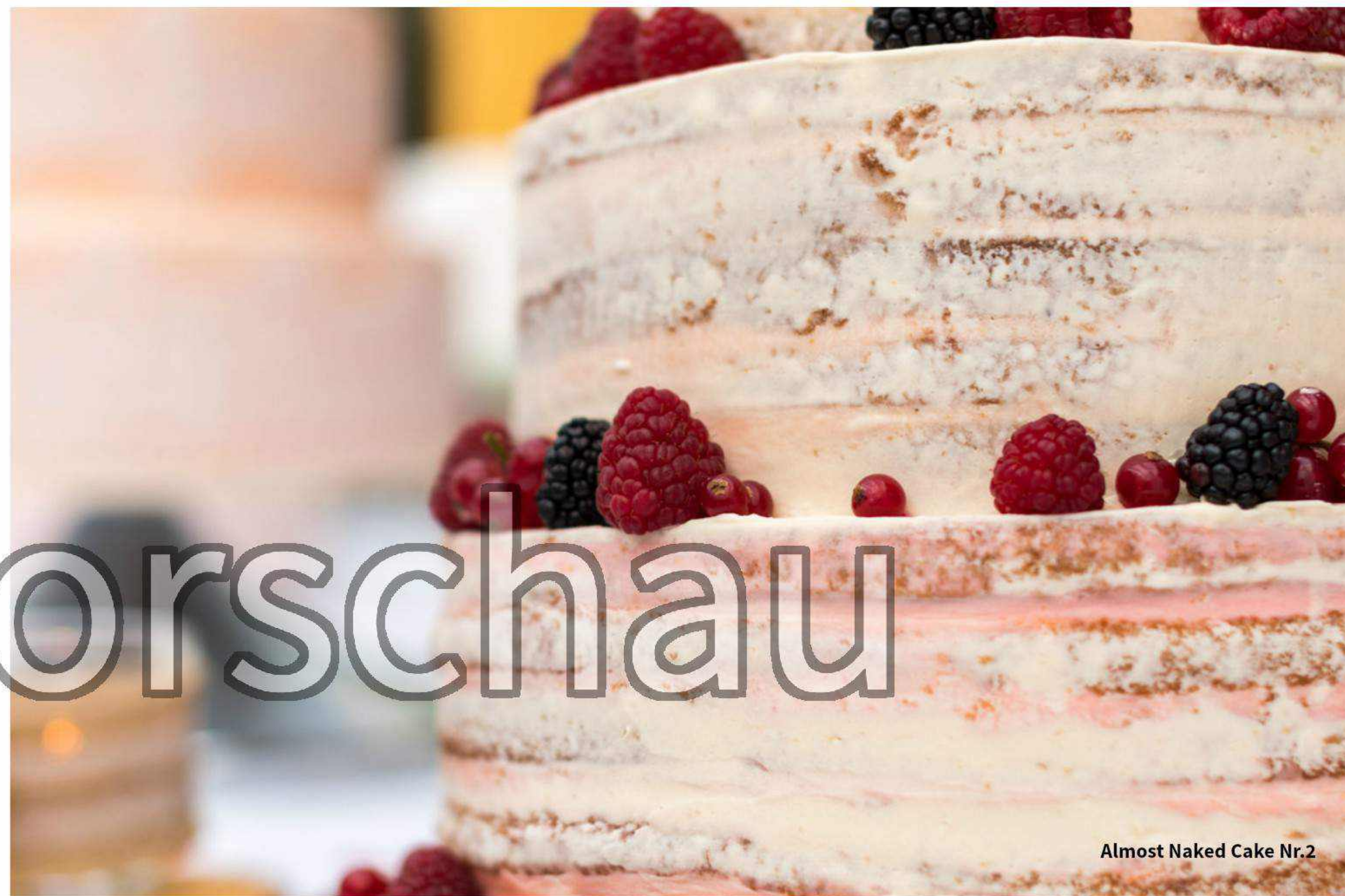
Almost-Naked-Cake mit Beeren