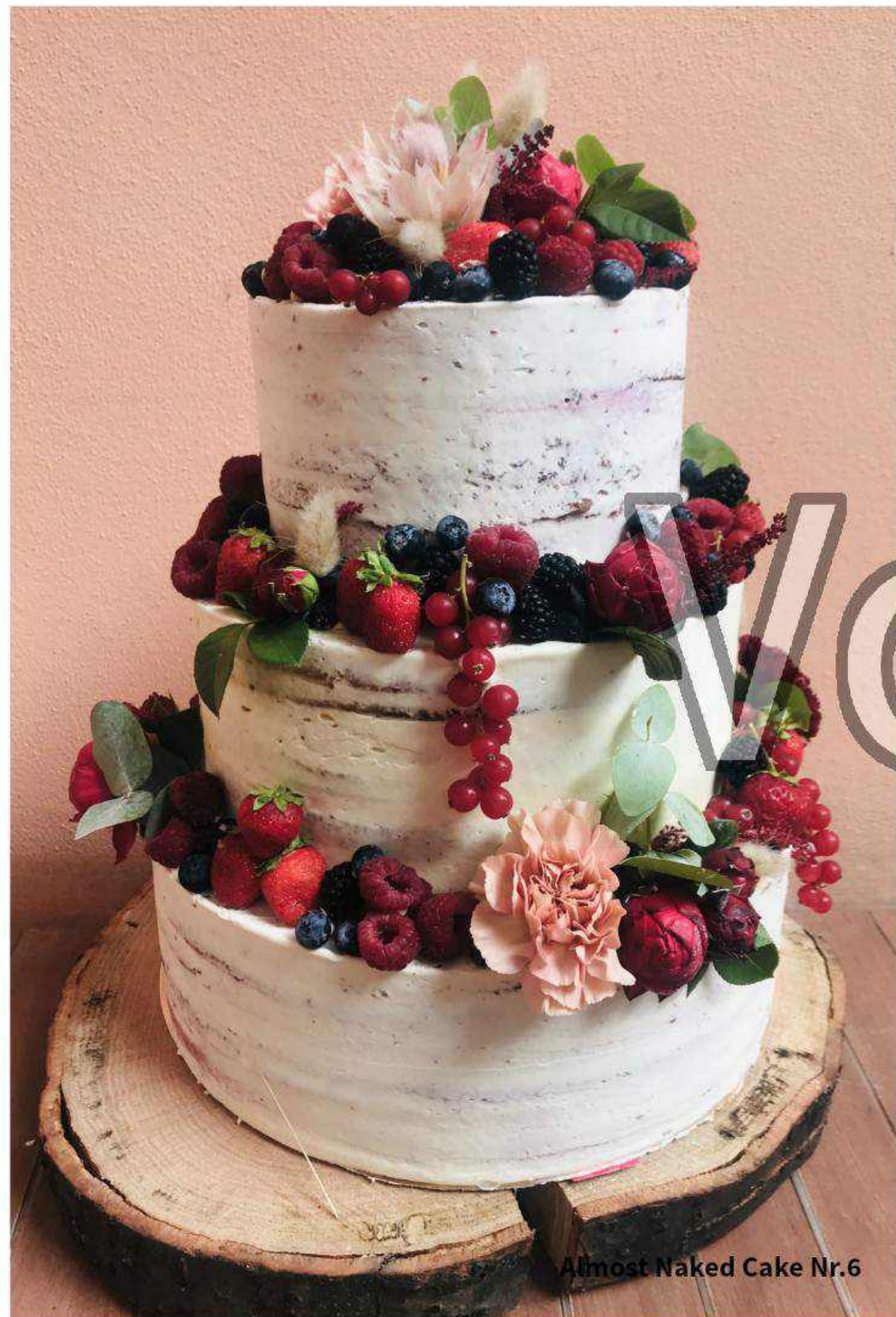
Almost Naked Cake Nr.6