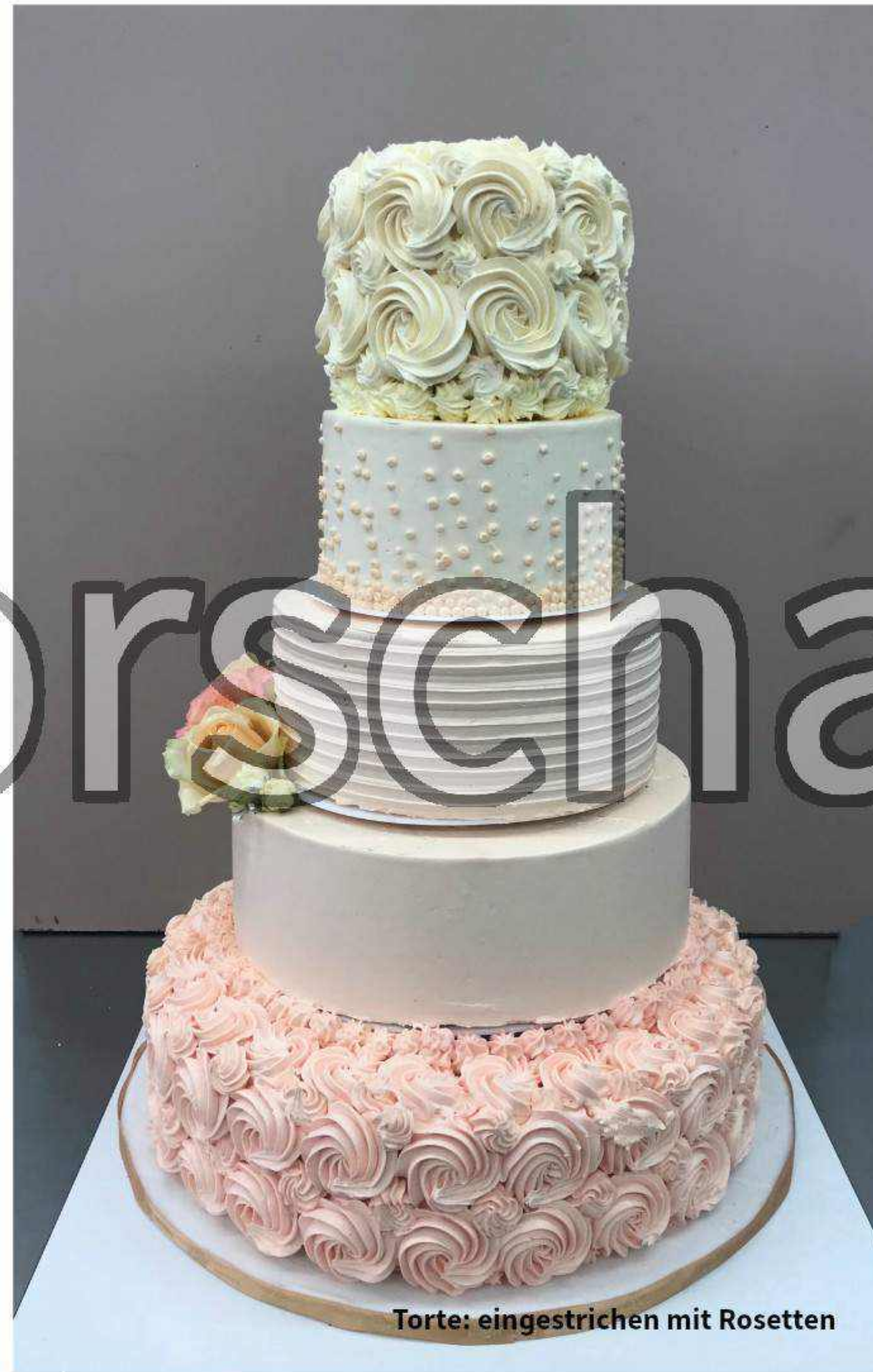
Torte: eingestrichen mit Rosetten