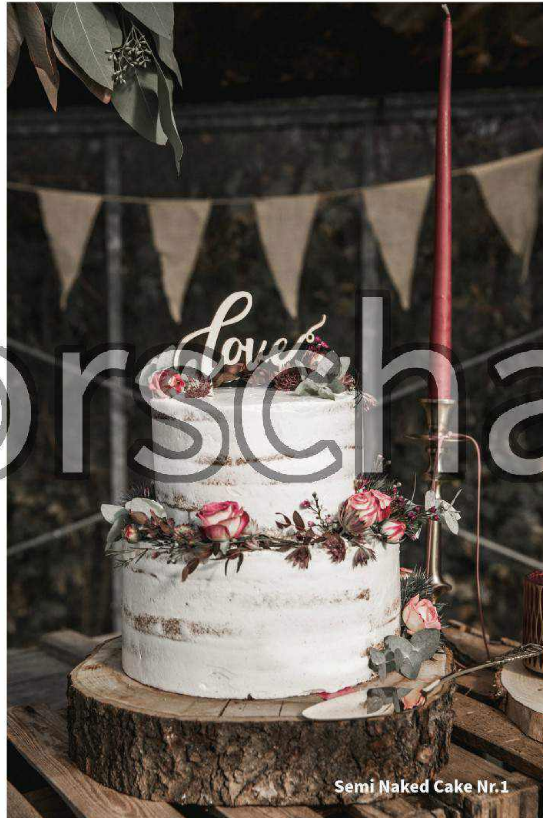
Semi Naked Cake Nr.1