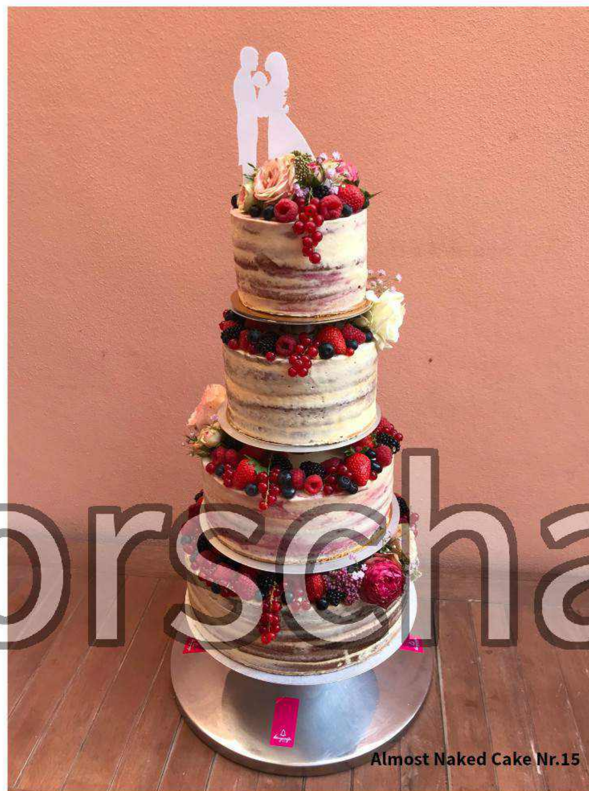
Almost Naked Cake Nr.15