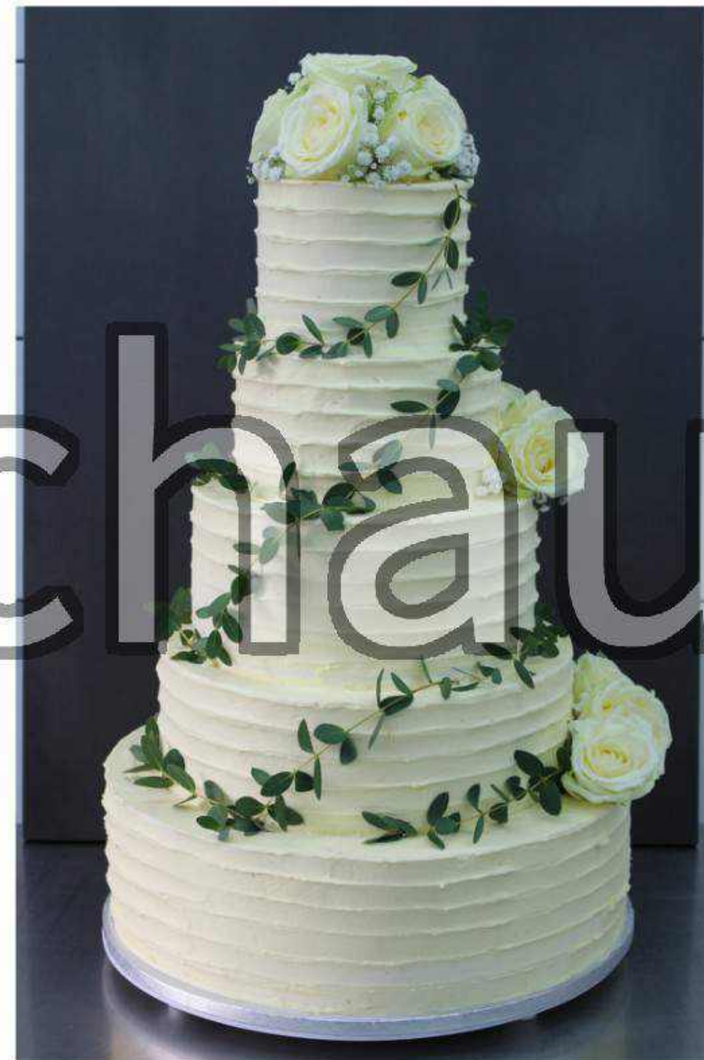
Streifeneinstrich-Torte Nr. 3