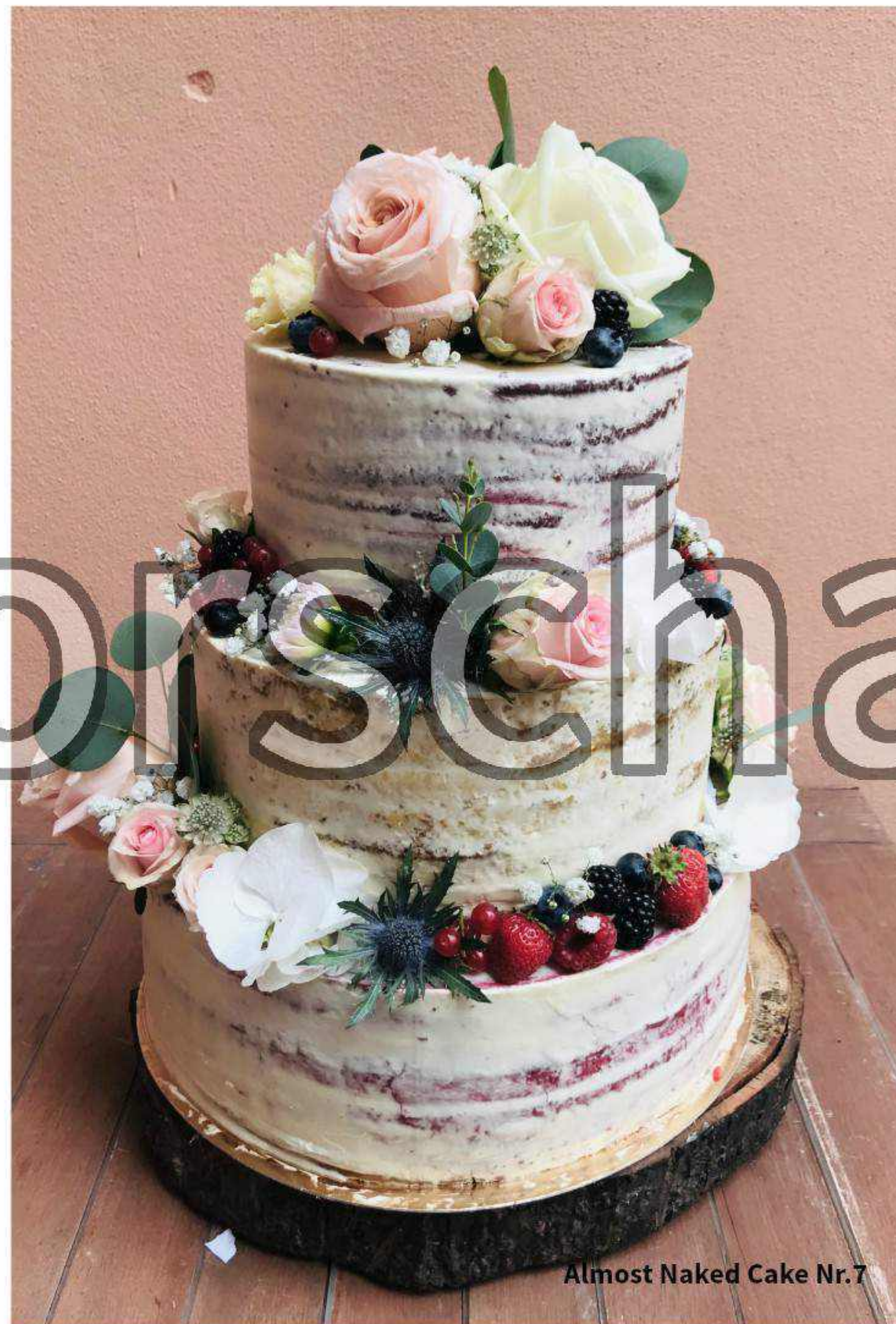
Almost Naked Cake Nr.7